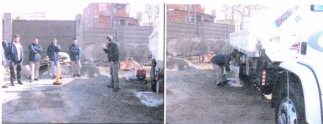
Foto 6(izq.): Explicación de acciones ante derrames. Foto 7 (der.) Utilización de material absorbente.